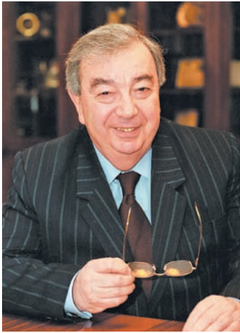
Евгений Примаков Академик РАН, Председатель Меркурий-Клуба

Альтернативы вступлению России в ВТО нет. Эта организация определяет правила поведения на мировых рынках, и через страны – ее участницы проходит почти 95% мировой торговли. К таким аргументам в пользу вступления России к ВТО следовало бы добавить: без присоединения к соглашениям ВТО в области наукоемких товаров и прав на интеллектуальную собственность весьма проблематичны преодоление технологического отставания и в перспективе выход России на мировой рынок высоких технологий. Следовательно, без вступления в ВТО не может быть осуществлен жизненно необходимый для страны переход на инновационный путь развития.