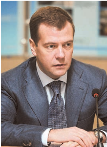
Дмитрий Медведев Председатель Правительства РФ