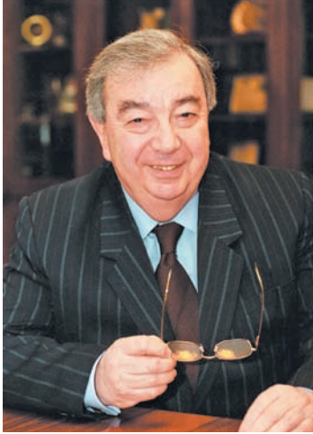
Евгений Примаков Академик РАН, Председатель Меркурий-Клуба

Альтернативы вступлению России в ВТО нет. Эта организация определяет правила поведения на мировых рынках, и через страны – ее участницы проходит почти 95% мировой торговли. К таким аргументам в пользу вступления России к ВТО следовало бы добавить: без присоединения к соглашениям ВТО в области наукоемких товаров и прав на интеллектуальную собственность весьма проблематичны преодоление технологического отставания и в перспективе выход России на мировой рынок высоких технологий. Следовательно, без вступления в ВТО не может быть осуществлен жизненно необходимый для страны переход на инновационный путь развития.